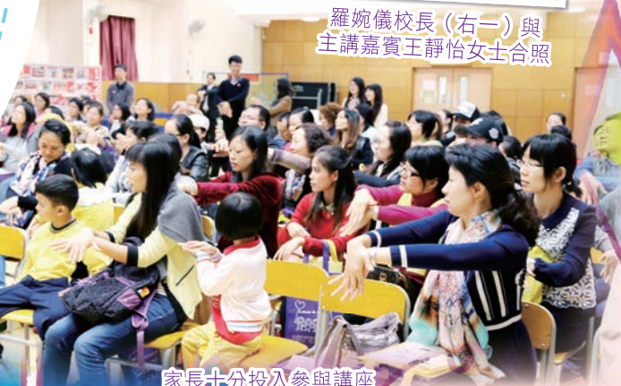
家長十分投入參與講座