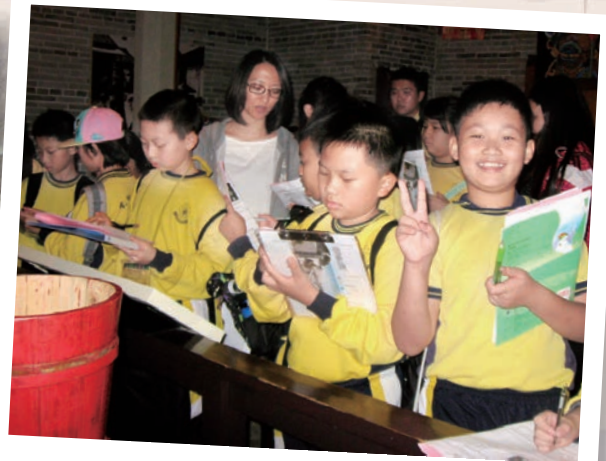
五年級學生參觀香港歷史博物館