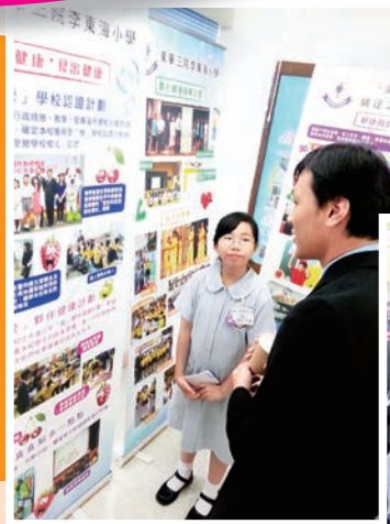
本校學生代表向來賓分享學校在推動健康校園的工作及心得