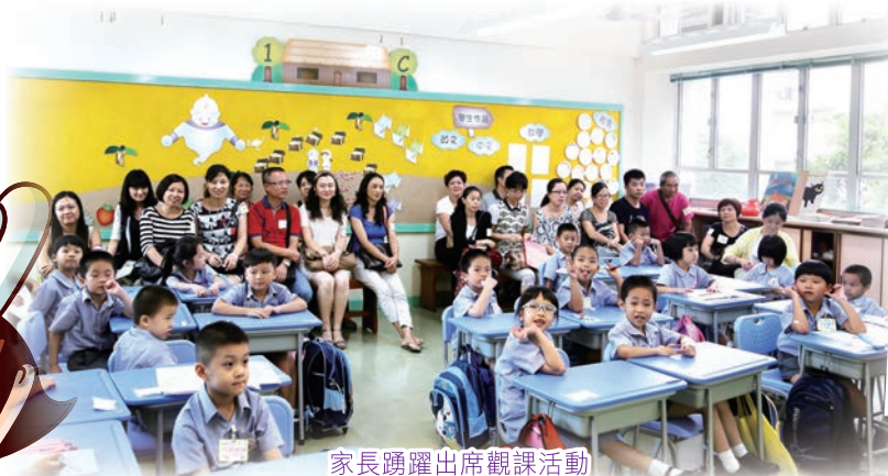
家長踴躍出席觀課活動

多天的家長觀課活動，約有226名家長到校參與。觀課後，老師更與家長進行交流，期間家長均對老師教學用心表示欣賞。