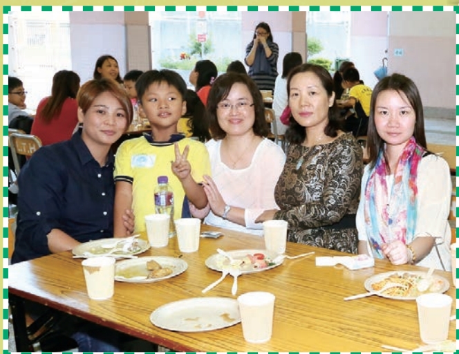
各人於會員大會後享用茶點