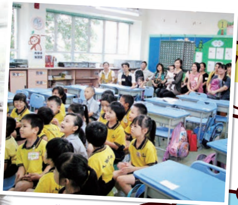
學生和家長都專心上課