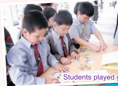
Students played games at recess

Finally, our finale show featured my favourite activity, the 'Meet your teachers board' quiz. This year we had eight teachers and the principal show us photos! The students loved looking at all the pictures. Our final quiz about the teachers was hard this year but that didn't stop our students from giving it their best.