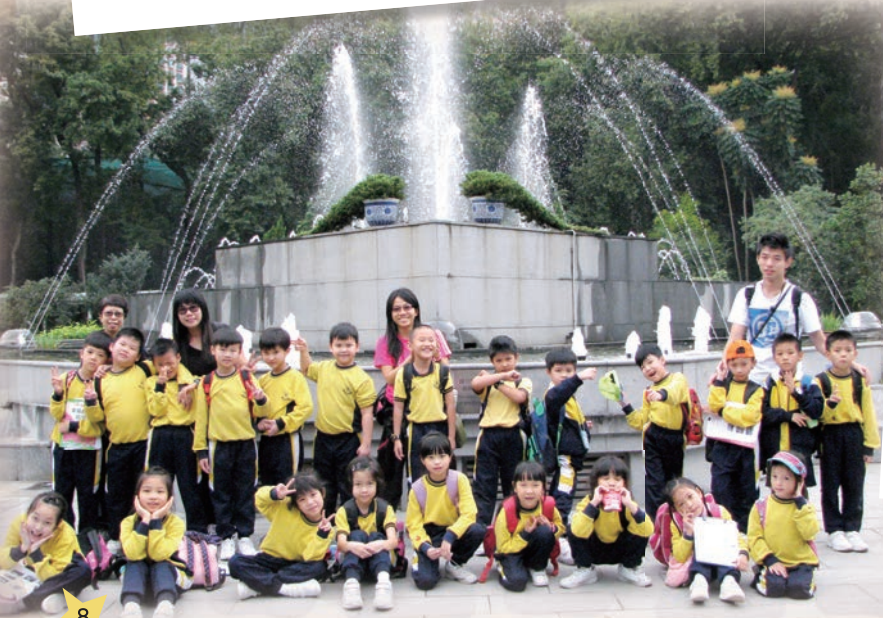
二年級同學在香港動植物公園大合照