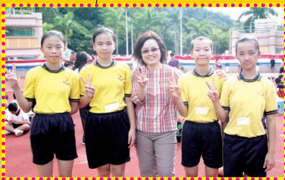
羅婉儀校長與女子甲組接力隊成員合照